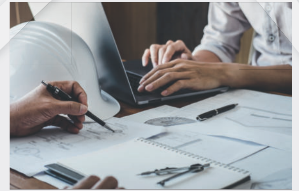
Bauingenieurwesen (Hochschule Augsburg)