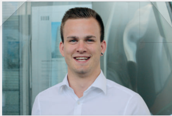
Bau-Projektmanagement (Hochschule Biberach)