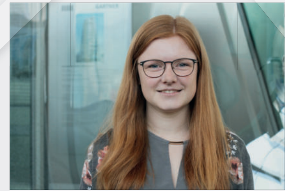
Fassadentechnik (Duale Hochschule Baden-Württemberg, Mosbach)