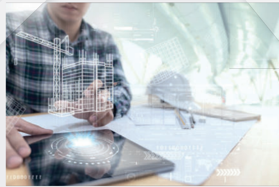
Digitaler Baumeister: Digitales Bauen und Planen (Hochschule Augsburg)